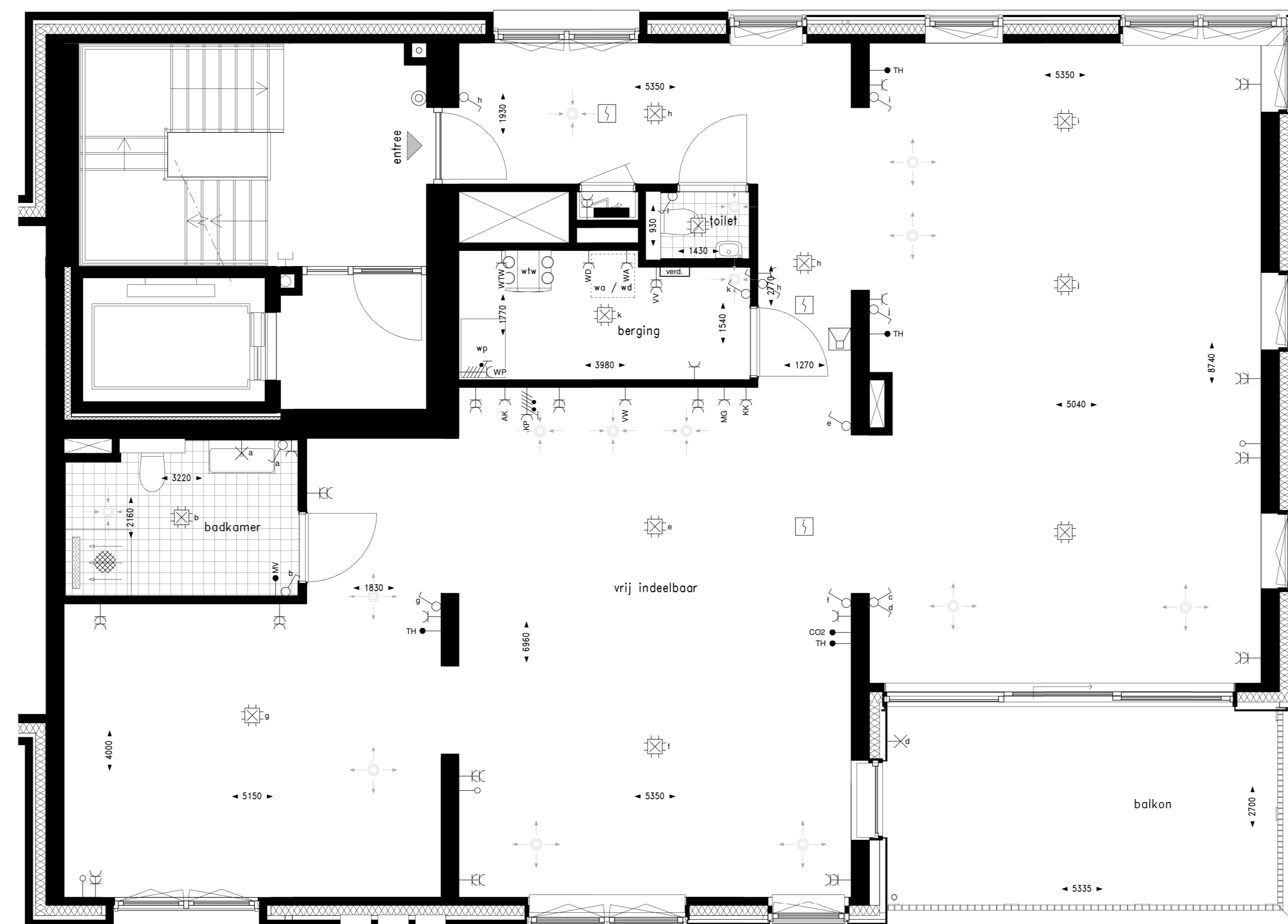
Bouwnummer 19 (3e verdieping) Bouwnummer 20 (4e verdieping)